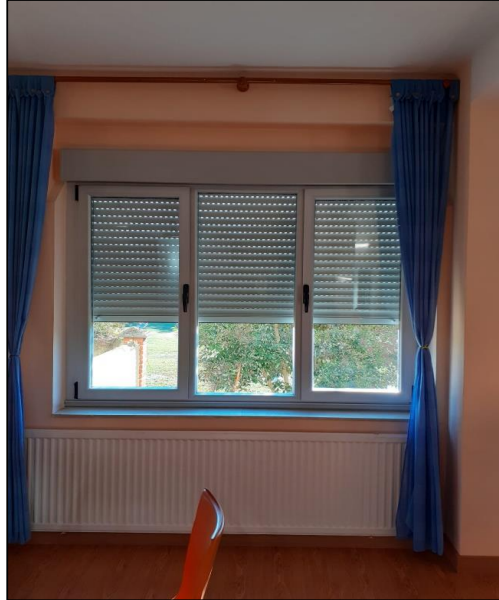
Imagen de una de las ventanas del Centro.

1: Se precisa motorizar las persianas de las ventanas señaladas en los planos.